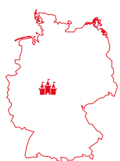
SCHLOSS WALDECK Hessen